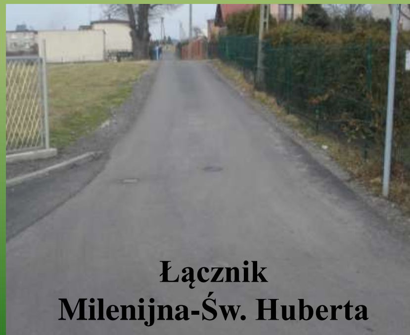
Łącznik Milenijna-Św. Huberta

Milenijna – droga do cmentarza Łącznik Milenijna – Św. Huberta